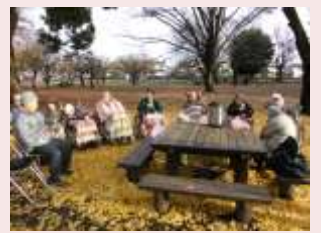
紅葉ハイク (若草公園)