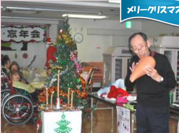
メリークリスマス!