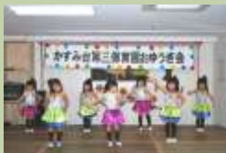
「ハブアナイスデー」