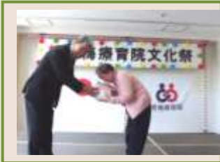
桐家族会会長より記念品の贈呈