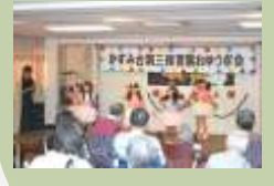
「トライエプリング」