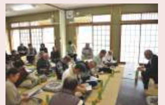
健康を守ろう地域高齢研修会