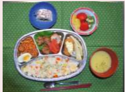
厨房職員手作りのオードブル