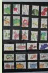
今井三丁目絵手紙の会