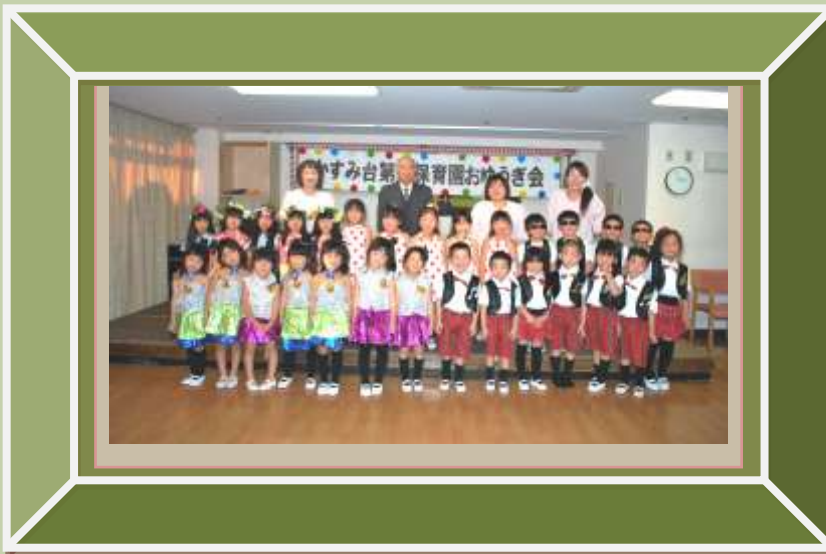
園での「お遊戯会」のあと、4歳児（うぐいす組さん）14名、5歳児（はと組さん）14名の可愛い訪問です