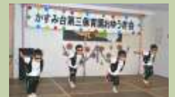
「パーフェクトヒューマン」