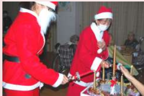
職員によるキャンドルサービス