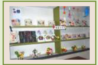
利用者様の手作りの作品で 器用さに感心させられます