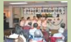
「オーバードライブ」