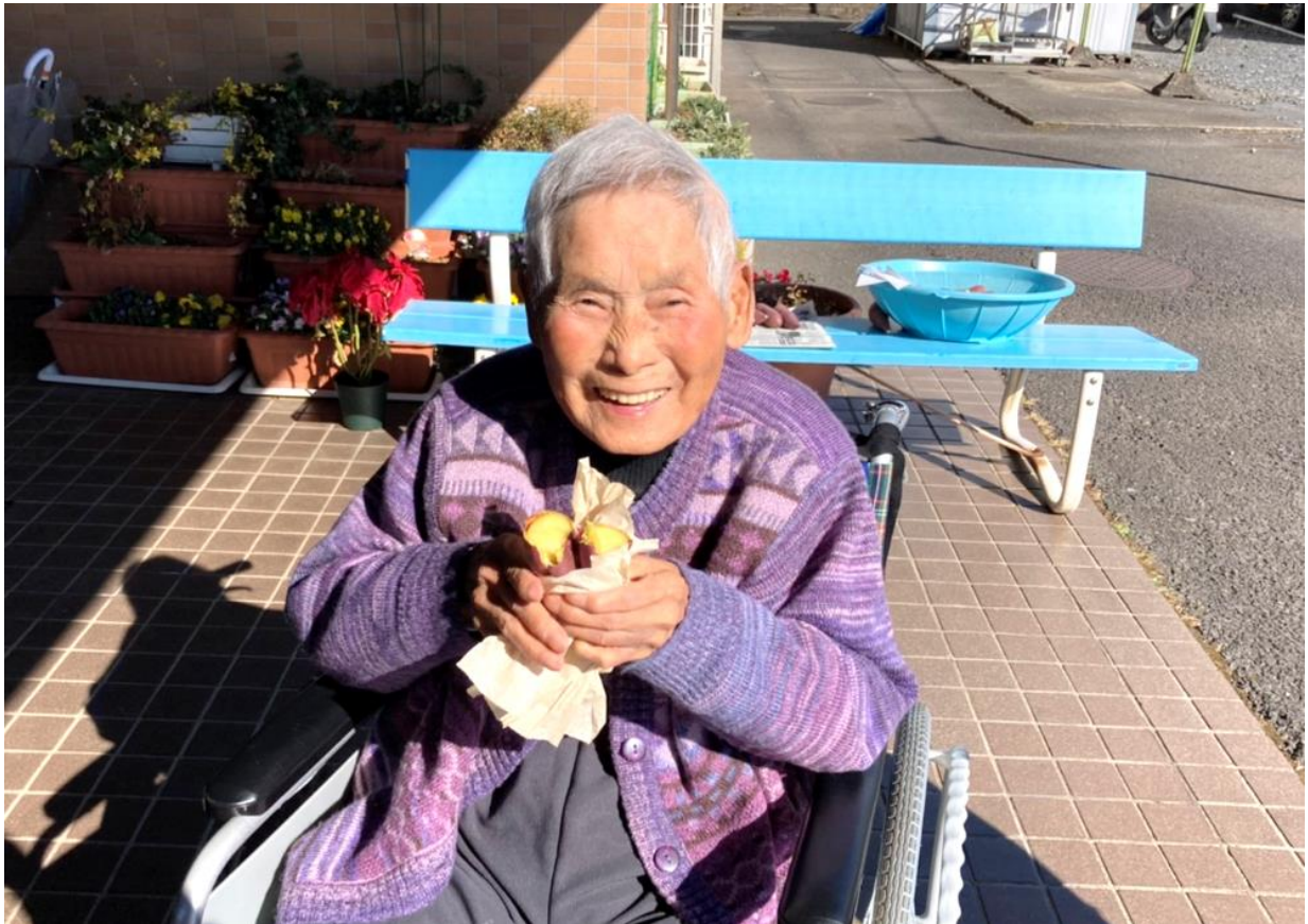
焼き芋パーティーにて