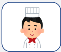
調理員 R6.3.4 入職

3月からお世話になっております。 今までは主に病院内の厨房で患者様や職員の食事を作っておりました。 高齢者施設での調理は初めてですが、今までの経験も生かしながら、 ご利用者様に喜ばれる食事を提供できればと思っております。 宜しくお願い致します。