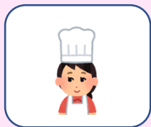
調理員 R6.4.1 入職

4月に入職し1ヶ月が経過しました。 私はこれまで14年間にわたり、社会福祉の仕事に従事してきました。 高齢者福祉・障害者福祉の経験を生かし、真摯にご利用者様に寄り添い 支援をしていきたいと思っております。 宜しくお願い致します。