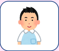
介護職員 R6.4.1 入職

3月からお世話になっております。 今までは主に病院内の厨房で患者様や職員の食事を作っておりました。 高齢者施設での調理は初めてですが、今までの経験も生かしながら、 ご利用者様に喜ばれる食事を提供できればと思っております。 宜しくお願い致します。